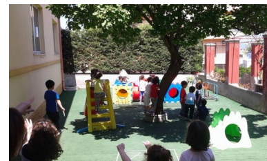
Area giochi scuola dell'infanzia