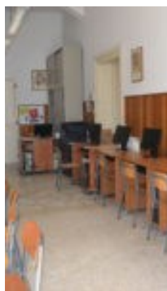
La nuova aula multimediale